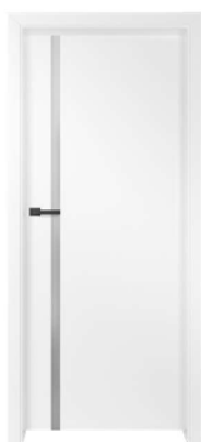
BALDUR 1 970,00 zł* / 1193,10 zł**