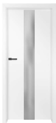
BALDUR 3 990,00 zł* / 1217,70 zł**