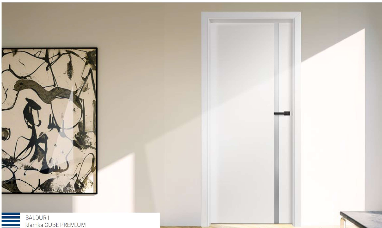
BALDUR 1 klamka CUBE PREMIUM

SKRZYDŁA DRZWIOWE LAKIEROWANE PRZYLGOWE, BEZPRZYLGOWE I REWERSYJNE