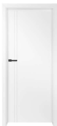
BALDUR 2 580,00 zł* / 713,40 zł**