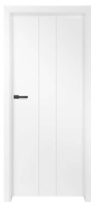
BALDUR 4 580,00 zł* / 713,40 zł**