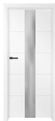
BALDUR 5 990,00 zł* / 1217,70 zł**