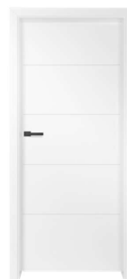
BALDUR 6 580,00 zł* / 713,40 zł**